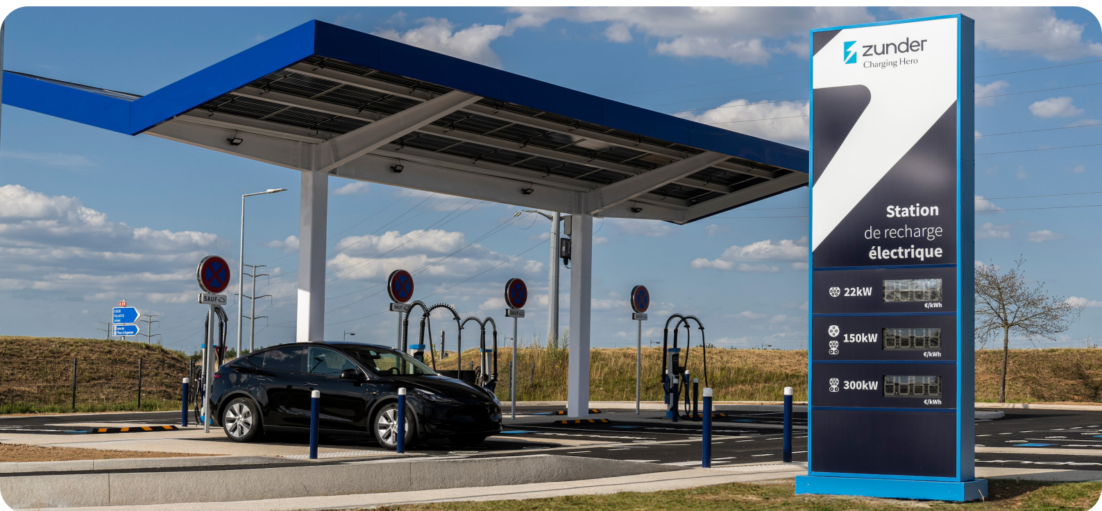
Sur l'image, la station de recharge Zunder à Argentan.